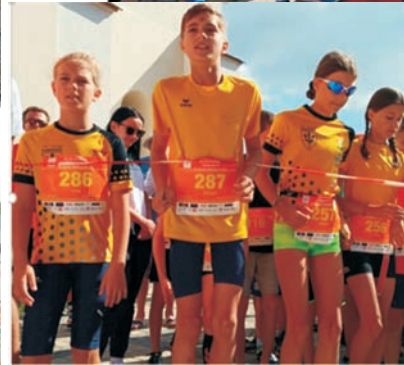
Freudiger Start bei den ganz Kleinen!