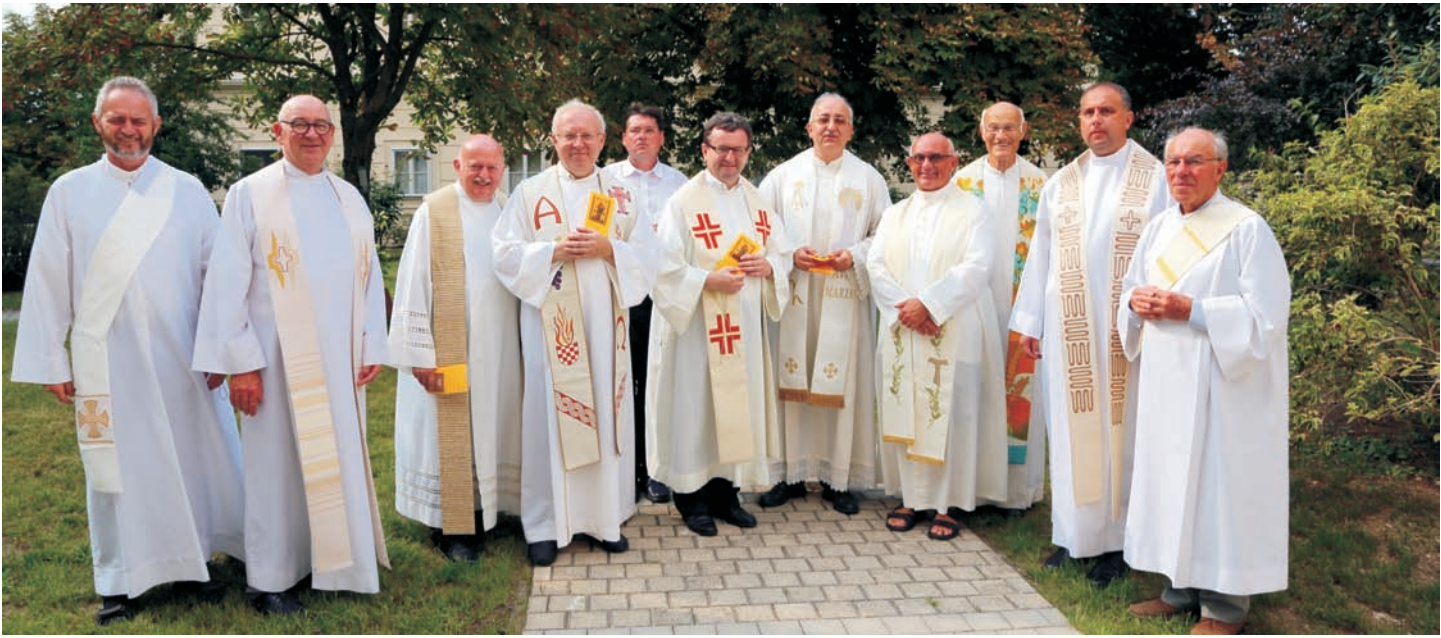
Gemeinsames Foto mit seinen Mitbrüdern