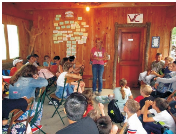
Četvrti razredi izvidjaju naše lipo Gradišće