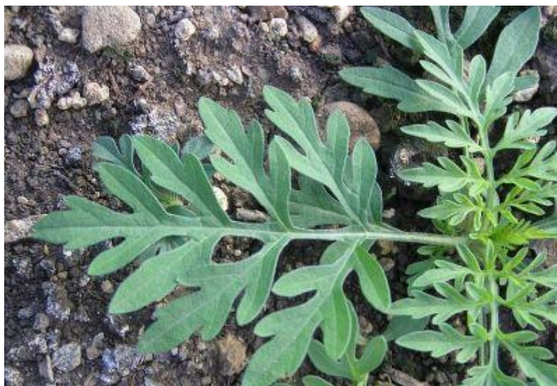
+ Sattgrüne Farbe der Blätter, weißliche Nervatur